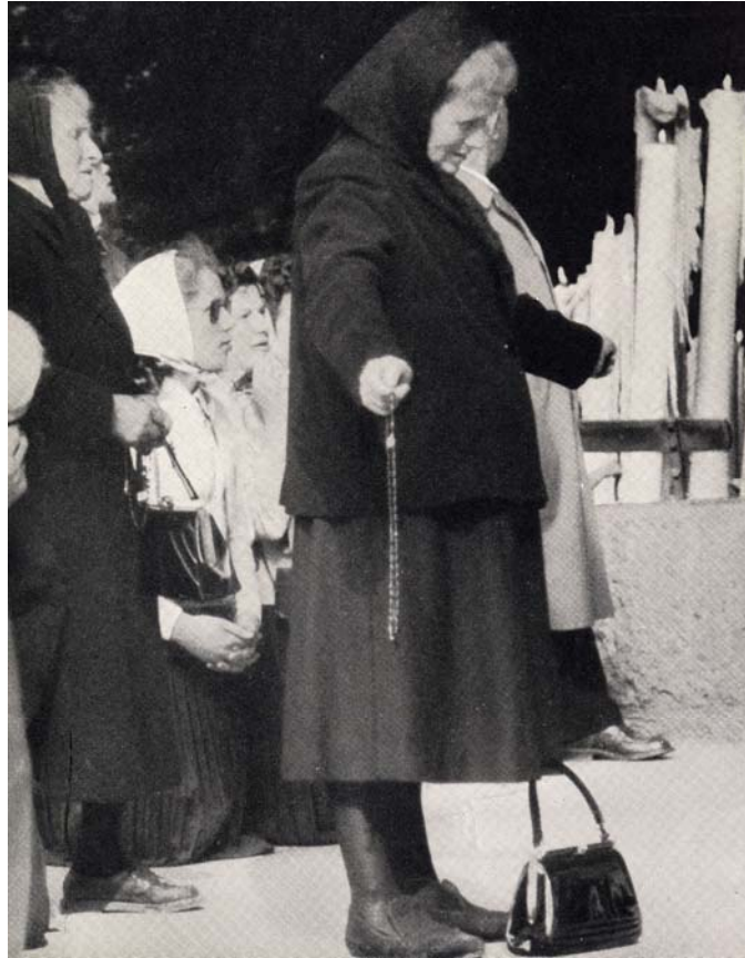
Abbi pietà di noi poveri...

Bernadette è difesa dagli assalti della gente dalla madre e dalla zia. La vedova Millet, che ha fatto benedire dal curato Peyramale una dozzina di ceri, grida: