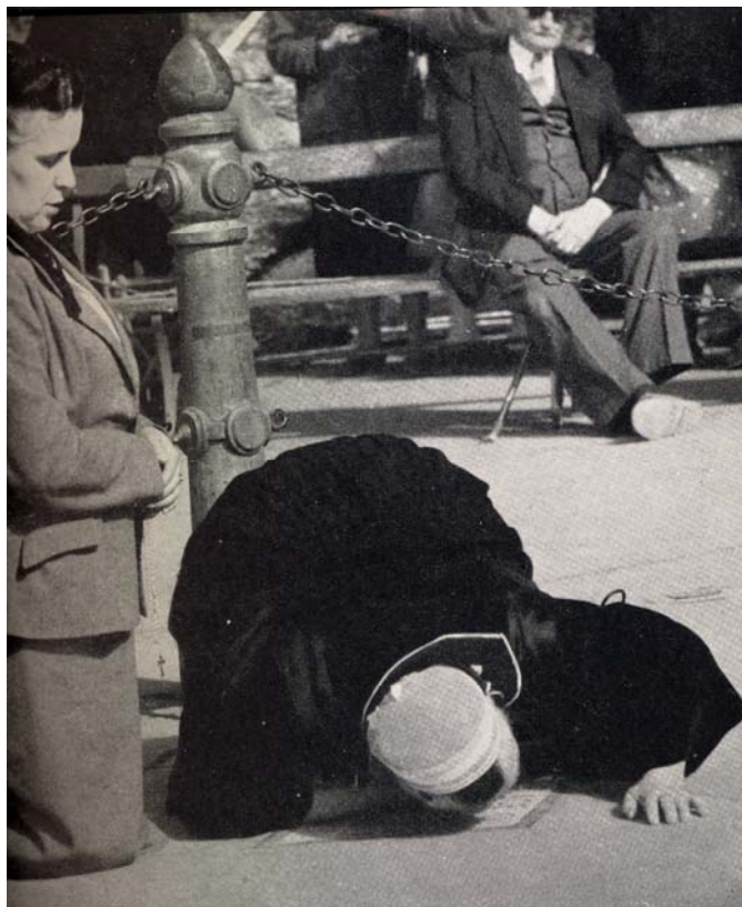
dove Bernadette si inginocchiò alla prima apparizione.

Due parole che concretano il messaggio per salvare il mondo.