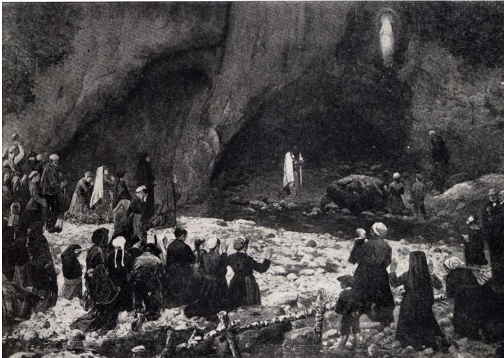
La Grotta com'era nel 1858

“No. La bellezza spirituale di Lourdes è nella immutata semplicità del luogo. Massabielle è quasi come allora, con qualche pavimentazione in più per proteggere dal fango le scarpe dei pellegrini e per permettere agli ammalati di procedere senza scosse verso le piscine”.