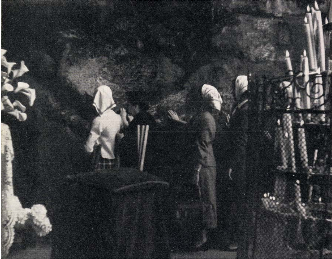
I pellegrini toccano la rupe di Massabielle

“Tutto ciò è commovente. La Grotta è il solo luogo dove sento che qualcosa di sovrumano si è svolto, anche se io non ne afferro la vastità. La Grotta giustifica i voti d'amore. Il resto è soltanto organizzazione”.